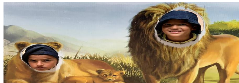
Sorties & découvertes