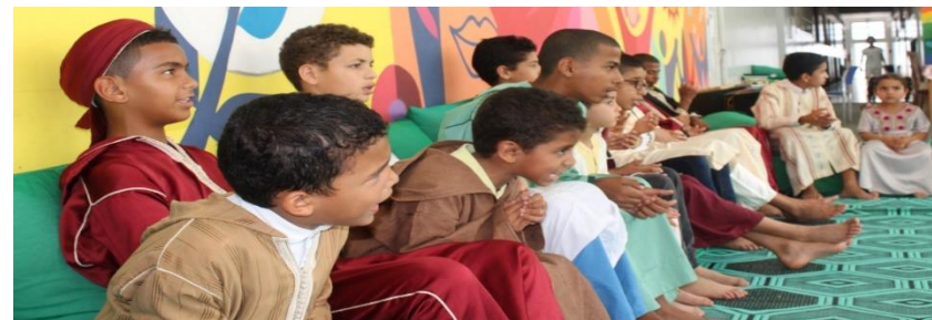
Coran & Histoires des prophètes