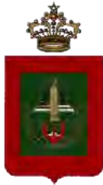
Wilaya de la Région de Casablanca - Settat

ⵜⴰⴳⴷⴰⵏⵜ ⵏ ⵏⵓⴷⴰⵢⵜ ⵏ ⴰⴳⴷⴰⵏⵜ ⵏ ⴰⴳⴷⴰⵏⵜ ⵏ ⴰⴳⴷⴰⵏⵜ ⴰⴳⴷⴰⵏⵜ ⵏ ⴰⴳⴷⴰⵏⵜ