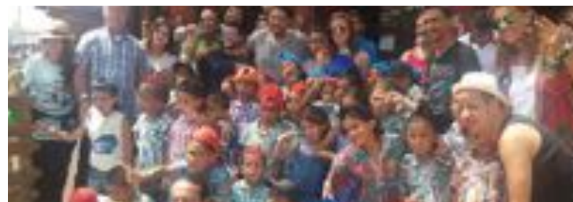
Sorties & découvertes