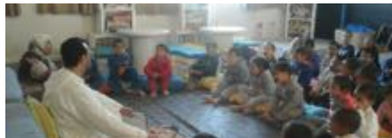
Coran & Histoires des prophètes